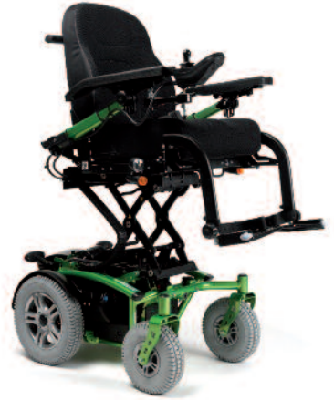
Disponible versión con elevación

Forest 3, ideal para espacios interiores y exteriores. El modelo Forest 3 está especialmente indicado para superar las irregularidades del terreno. Gracias a su eje pivotante anterior, las 4 ruedas están en contacto con el suelo en todo momento, incluso al afrontar grandes desniveles (hasta una diferencia de 100 mm)